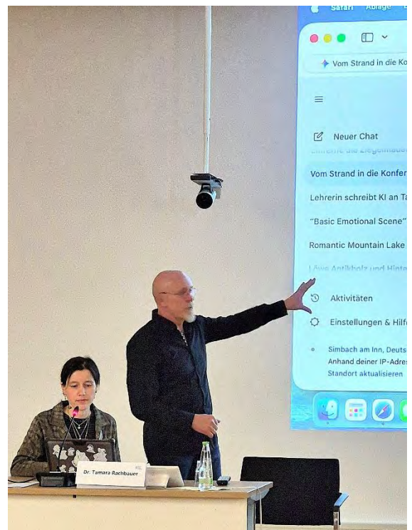
Referat und Workshop Rachbauer