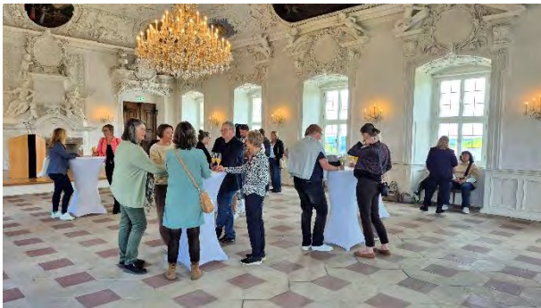
... im Kaisersaal