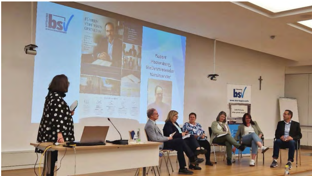
Gesprächsrunde der Verbandsführung